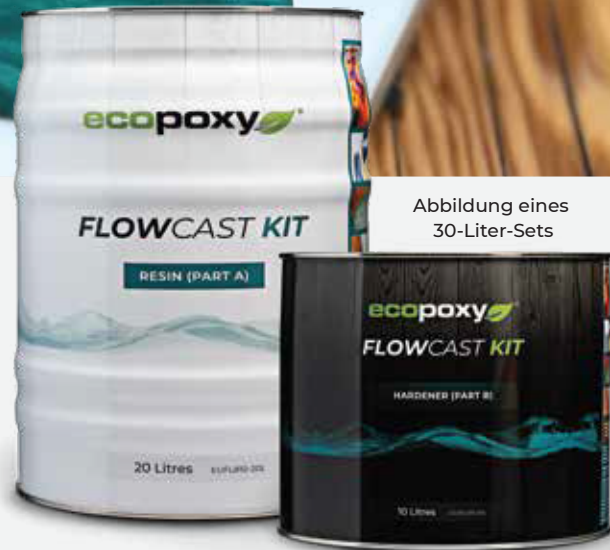
Abbildung eines 30-Liter-Sets

FlowCast® stellt die nächste Generation von klarem Gießharz dar! Es ist dünner, klarer und enthält mehr biologisch-erneuerbare Bestandteile! Wenn die beiden Teile kombiniert werden, härtet es aus und sorgt für ein kristallklares, beständiges Finish, wobei die maximale Dicke 38 mm beträgt. Verwenden Sie FlowCast®-Epoxidharz alleine, um ein kristallklares Finish zu erhalten, oder fügen Sie unsere Pigmente hinzu, um individuelle Farben und Effekte zu erzielen.