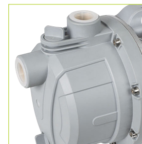
SALIDA DE IMPULSIÓN \varnothing 1"