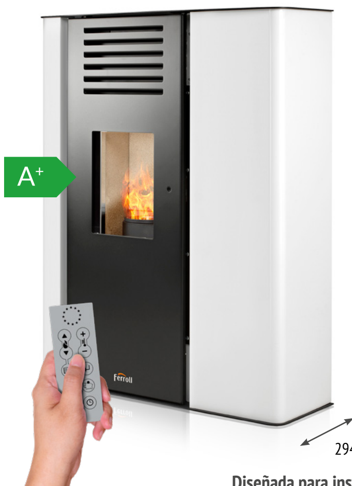
Mando a distancia incluido

Estufa de pellets modulante en acero de fondo reducido de 9 kW