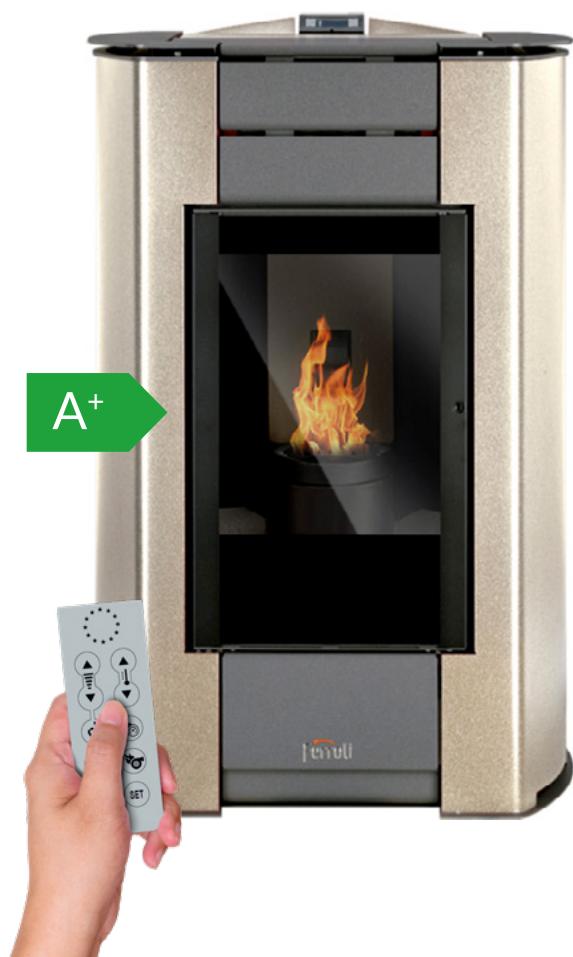
Mando a distancia incluido

Estufa de pellets modulante en acero de 14,1 kW