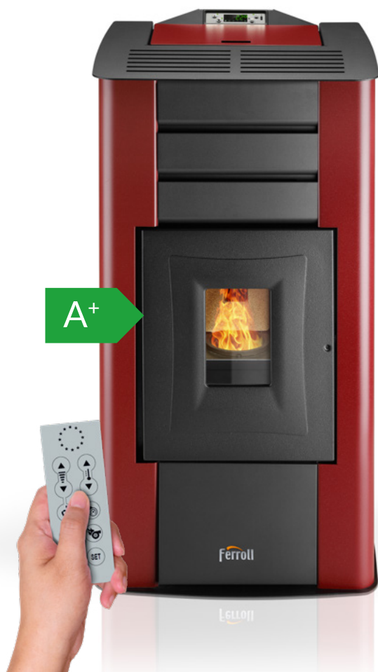
Mando a distancia incluido

Termoestufa de pellets modulante en hierro fundido y acero de 12,7 kW