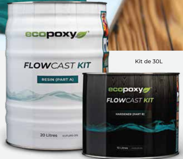
Kit de 30L