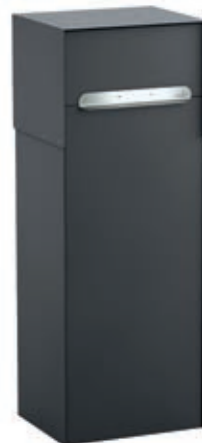
NEGRO EP3154 EAN-8425181738511

Existe un modelo de doble acceso, de forma que la boca del buzón quede hacia la calle y la puerta del buzón quede en el interior del muro de la vivienda, para poder extraer los paquetes desde dentro.