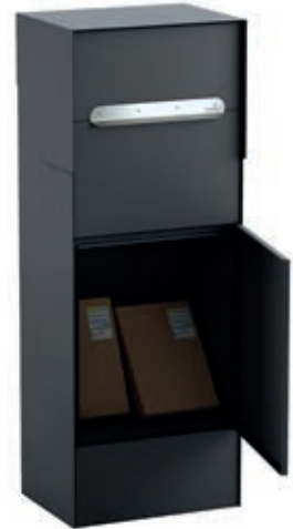
NEGRO EP3104 EAN-8425181738504