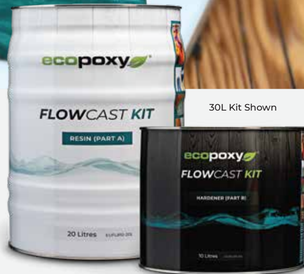
30L Kit Shown