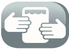
Depósito de agua de alta capacidad