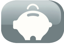
Tecnología ultrasónica: consumo energético bajo