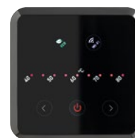
El panel de control permite la selección visualización de la temperatura del agua acumulada.