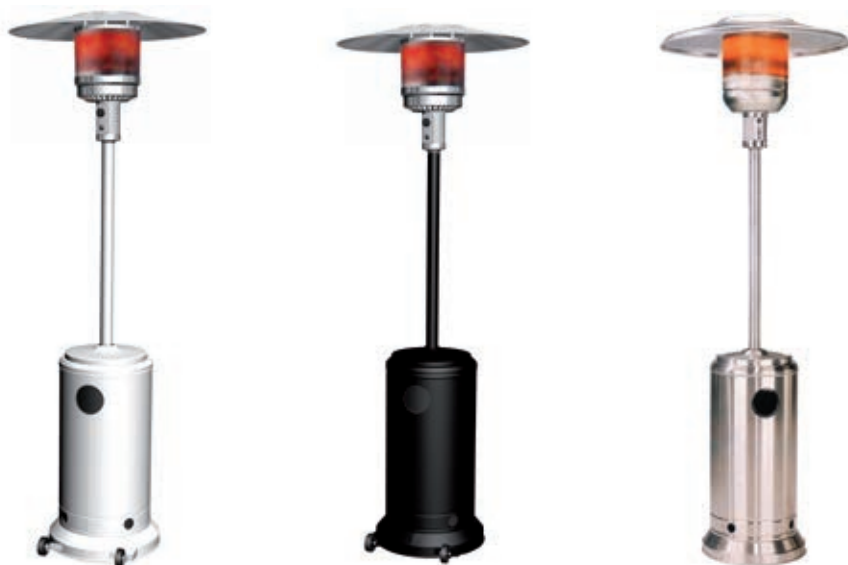
CORONA en colores blanco, negro e inox