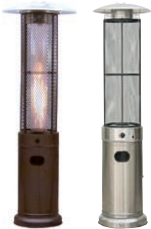
FLAMME Redonda negra e inox