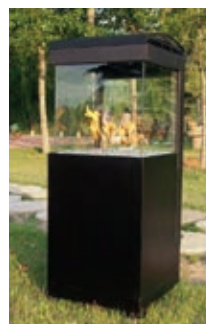
OSLO 4 caras