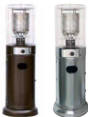
CORONA Baja negra e inox