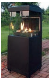
OSLO 3 caras