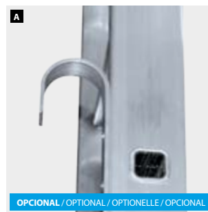
3 Bloqueo de seguridad de aluminio. Aluminum safety lock. Blocage de sécurité en aluminium. Trava de segurança de alumínio.