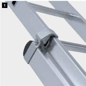
1 Sistema de deslizamiento de aluminio. Aluminum sliding system. Système de glissement en aluminium. Sistema deslizante de alumínio.