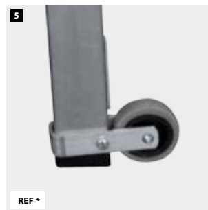
5 Rueda de desplazamiento de ø80 mm. Scroll wheel of ø80 mm. Roue de déplacement de ø80 mm. Roda de rolagem de ø80 mm.