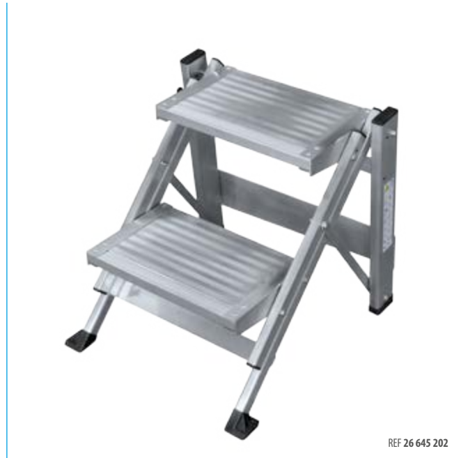
REF 26 645 202