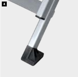
4 Tapafinal de PVC con relieves antideslizantes. PVC end cap with anti-slip reliefs. Patin en PVC avec reliefs antidérapants. Pé de PVC com relevos antiderrapantes.