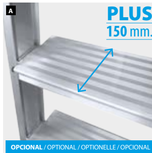
PLUS 150 mm.