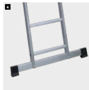
4 Base estabilizadora. Stabilizer base. Base stabilisatrice. Base estabilizadora.