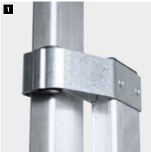
1 Sistema de deslizamiento de aluminio. Aluminum sliding system. Système de glissement en aluminium. Sistema deslizante de alumínio.