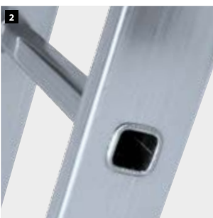
2 Peldaños engastados con relieves antideslizantes. Rungs set with anti-slip reliefs. Échelons sertis avec des reliefs antidérapants. Degraus inseridos com relevos antiderrapantes.