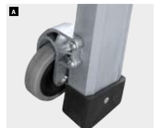
OPCIONAL / OPTIONAL / OPTIONELLE / OPCIONAL