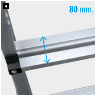
4 Peldaños engastados con doble superficie antideslizante. Rungs set with double non-slip surface. Échelons sertis avec double surface antidérapante. Degraus com superfície dupla antiderrapante.